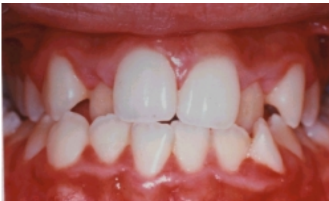
Figura 1. Se observa lingualización de incisivos laterales superiores y mordida cruzada bilateral.

Se logró una verdadera separación de la sutura media maxilar como se demuestra radiográficamente, con mínima inclinación de los ejes de molares y premolares de acuerdo con la investigación de Handelman et al. 14 , y como consecuencia hubo una corrección de la mordida cruzada posterior 9 (Figura 6, Cuadro 1). Como era de esperarse, según lo observado por Will et al. 7 la mandíbula sufrió cierto grado de rotación posteroinferior con el respectivo aumento del ángulo ANB en un grado y del plano mandibular en dos grados (Cuadro 2). En contraste con el