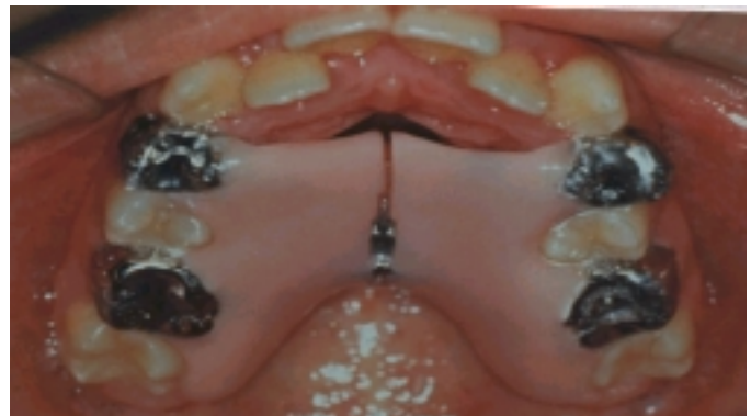
Figura 2. Disyuntor palatino acrílico anclado a primeros molares y premolares con coronas de acero. Se activa dos cuartos de vuelta por día.