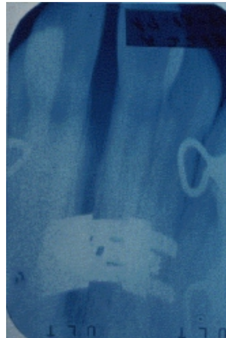
Figura 4. Nótese la separación del paladar en la línea media inmediatamente después de la disyunción.