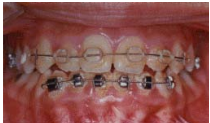
Figura 6. Corrección de la mordida cruzada posterior con disyunción maxilar.