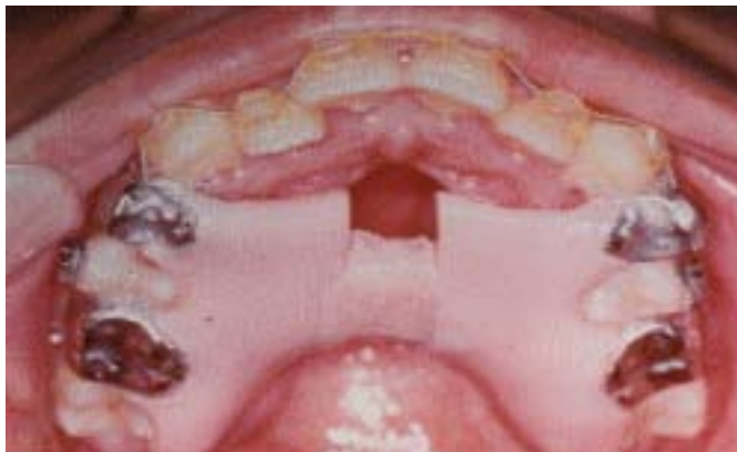
Figura 3. Luego de dos semanas de activación continua del tornillo medio se agrega acrílico al tornillo, dejándolo como contención de 3 a 6 meses.